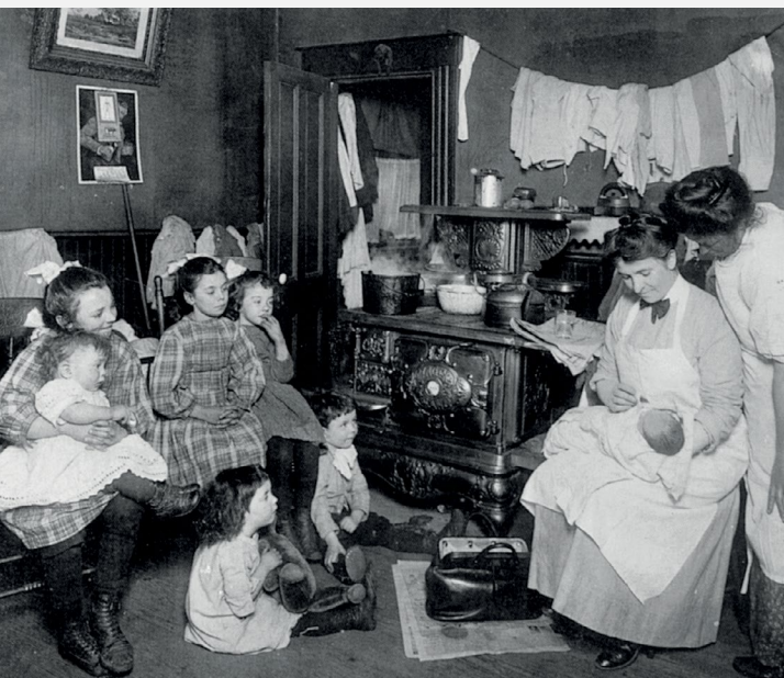
Década de 1900 - Uma enfermeira visitando a casa de uma família.

Há mais de 150 anos, a MetLife tem ajudado diferentes gerações de pessoas a construir um futuro mais seguro. Quer você seja novo na MetLife ou conheça nosso rico legado, estamos orgulhosos de compartilhar o alicerce sobre o qual a MetLife foi construída.